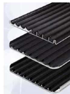
Marquage possible de matériels