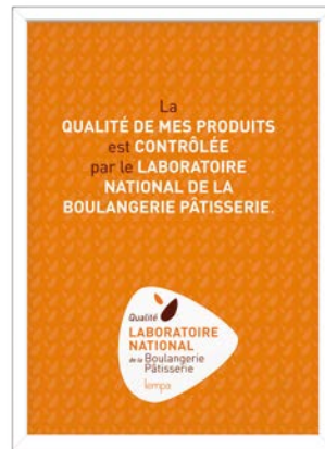
Signalétique Marque Affiche 30x40 cm Affiche de caisse A4